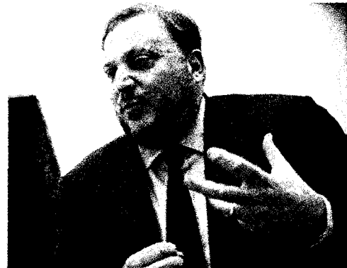
Giorgio Tonini, senatore del Partito Democratico