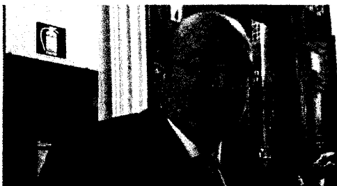
Lorenzo Dellai, capogruppo di Scelta Civica alla Camera

Ma Dellai è duro: «Servono larghe intese, il Pd deve capirlo»